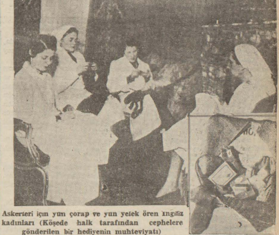
Askerleri için yün çorap ve yün yelek ören İngiliz kadınları (Köşede halk tarafından cephelere gönderilen bir hediyein muhteviyatı)